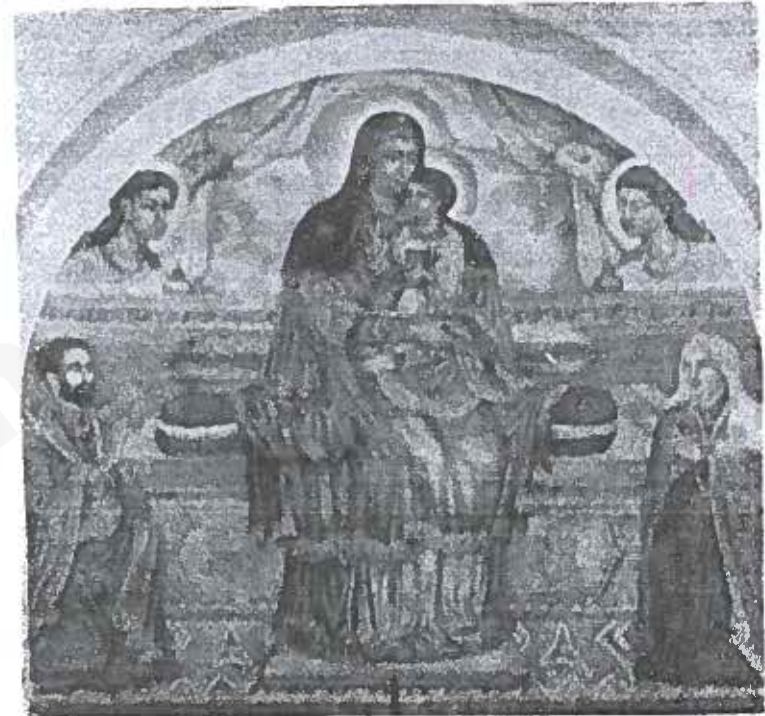
ድንግል ግርያም ሆይ ለምኒልክ ።

ይኻ መጽሐፍ በቅድስት ግርያም ስም ብዙ ቤተ ክርስቲያን ላሳነፁት ልዩ ልዩ በጉ አድራጉት ፈጽመው በክብር ለአረፉት ለግርግዊት እቴጌ መነን መታሰቢያ ይሆን ዘንድ ተሰጠ ፡የጻድቅ መታሰቢያው ለዘለዓለም ይኖራል። (መዝ ፻፲፮ ፱ ) ።