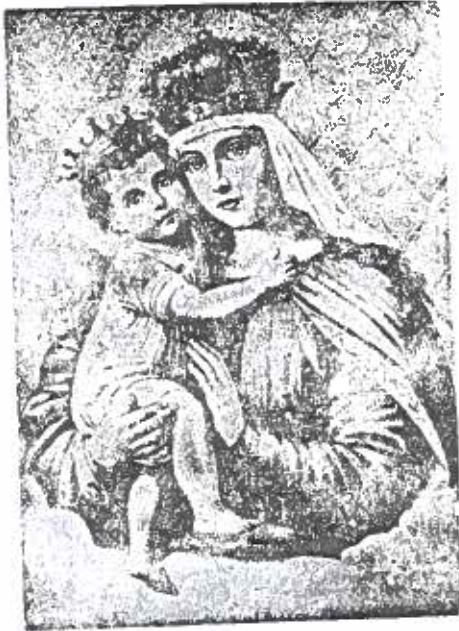
“እንች ዘሴቶች ተሰይተሽ የተባረክሽ ነሽ። (ሉቃ ፳፻ ፳፱ ፤ ፵፱) በለዚህ በእማን ንግሥት በእማን ክብርት እያልን እናመሰግናለን እናክብርባለን ኃጢአታችንንም ያስተውረዳልን ዘንድ በለኛ ለምኝልን ።

ያናችን ይኸን ሁሉ አስረጅ ገንዘብ ስላደረገች ንጹሕ ምስጋና ለመቤታችን በሰፊው ጽፋ ስታመሰገን ትኖራለች ።